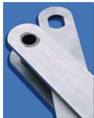
Beispiel: T-ALPHA Patent- lochung

Ingenieure von THIELE beraten vor Ort und analysieren gemeinsam mit Ihnen die förder-technischen Aufgaben und helfen bei der Dimensionierung des beweglichen Kettensystems. Kundenspezifische technische Lösungen werden anschließend im Detail in der THIELE eigenen Konstruktionsabteilung entwickelt.